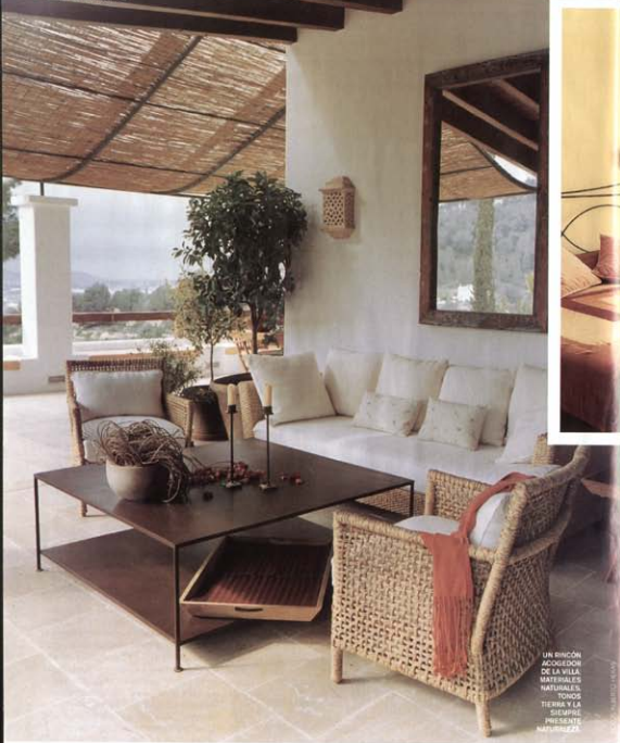
UN BINCÓN ACCESORIO DE LA VILLA. MATERIALES NATURALES, TONOS TIERRA Y LA SIEMPRE PRESENTE NATURALEZA.