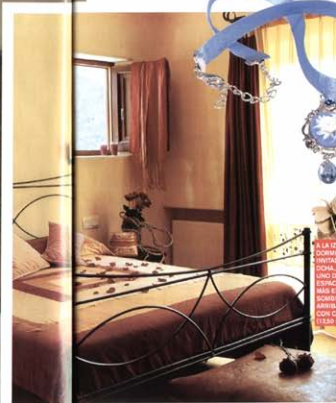
«A LA IZDA, UN DORMITORIO DE «SINTEOS»; A LA DCHA, LA COCINA JUNTO DE LOS TERRAZCOS CON MÁS ENCANTO, Y SOMBRERO (AZ) ES LA BARRA COLGANTE CON CAMARERO (LEMO) ES

Inmediatamente levé anclas y me puse a navegar porque querían salir también la noche siguiente. Me doy cuenta de que fue una estupidez. Al final volví en otras ocasiones y encontré esta casa...». Can Can —nombre original de la residencia— es un hogar muy personal que refleja una fusión entre distintas arquitecturas, y con detalles de las típicas villas payesas: «Al principio había dos casas, pero no tenían ningún estilo, les faltaba algo. Tardamos casi tres años en derribarlo todo y empezar otra vez. No es una casa típicamente ibicenca de ventanas pequeñas y, de hecho, quería hacerla ligeramente mejicana. Además, utilizamos todos los materiales y tejidos de Monsoon. Al final, creo que refleja mi propio estilo». Su rutina diaria en Ibiza es envidiable: «Cuando vengo, hago yoga, voy a navegar, juego al tenis... Me gusta venir